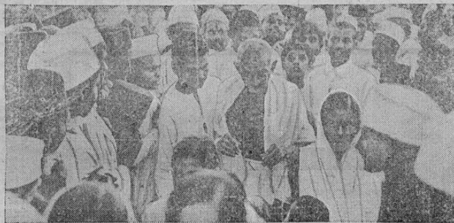
Esta interesante fotografía muestra a Mahatm a Gandhi en su famosa "marcha al mar" que dio por resultado su arresto "como perturbador del orden público"