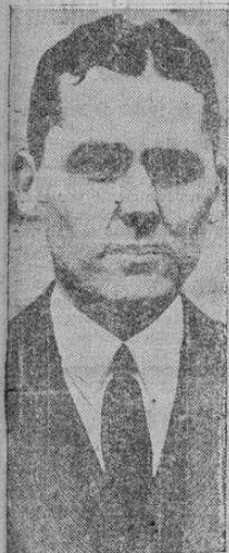
El capitán George A. Percy, conocida figura del mundo deportivo americano, ha anunciado su próximo matrimonio con la actriz Miss Elia Enders