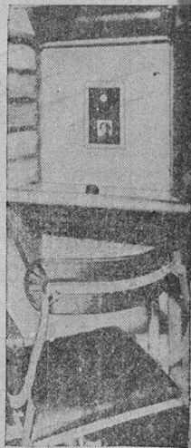
He aquí uno de los aparatos de televisión, exhibido en la reciente exposición del ramo en Nueva York. Muy pronto tales aparatos estarán en servicio en las principales ciudades del mundo